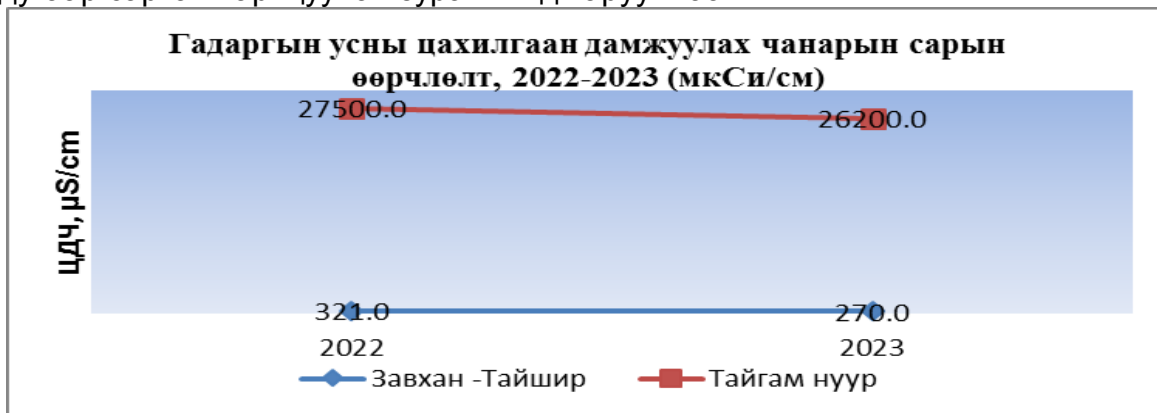
Зураг.1 Гадаргын усны цахилгаан дамжуулах чанар

Гадаргын усны цахилгаан дамжуулах чанарын өөрчлөлтийг 2022 оны 8 дугаар сартай харьцуулан зураг.1 – д харууллаа.