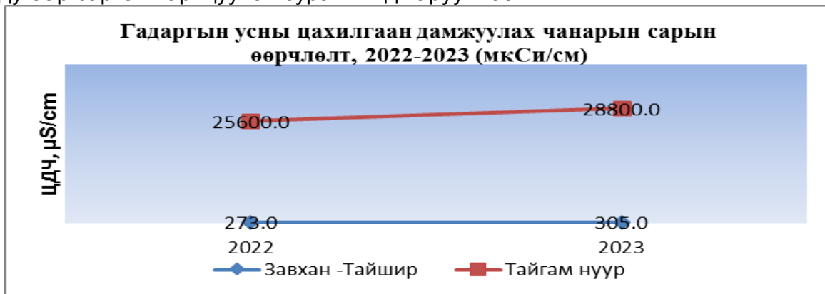
Зураг.1 Гадаргын усны цахилгаан дамжуулах чанар

Гадаргын усны цахилгаан дамжуулах чанарын өөрчлөлтийг 2022 оны 8 дугаар сартай харьцуулан зураг.1 – д харууллаа.